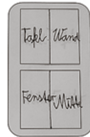
Welcher Schalter schaltet welche Lampen ein?

Lichtschalter im Raum: 104 Wo befinden sich Lichtschalter? Links neben der Tür.